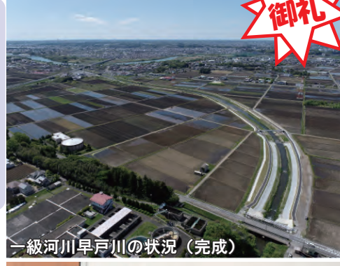
一級河川早戸川の状況（完成）

令和5年10月18日（水）に茨城県土木部の田村土木部長と面会を行い、ひたちなか市の単独の中央要望、国と茨城県と連携した流域治水対策や本市と連携し整備を進めている100mm/h安心プラン「中丸川流域における浸水被害軽減プラン」の整備として、中丸川調節池整備、中丸川河川改修工事の進捗等話をしました。また、令和4年度末には、早戸川河川改修工事として、堤防の危機管理型ハード対策が完成したことを御礼しました。その後、本市の流域治水の取り組みを説明し、今後も茨城県と連携しながら治水対策を進めていく話をしました。